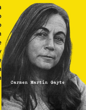
Carmen Martín Gayte

Necesito, al menos, dos años para terminar una novela. Además no tengo por qué escribirla de corrido. Tomo notas en mis cuadernos sobre un personaje, sobre la sensación que me produce una cosa, un acontecimiento y tal vez, esas notas con el tiempo se convierten en trama. Un cuento o un poema es el resultado de una idea, son fruto del momento.