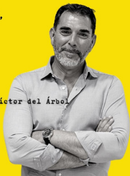
Victor del Árbol

Me meto en el libro como en una vivencia, no como en un producto.